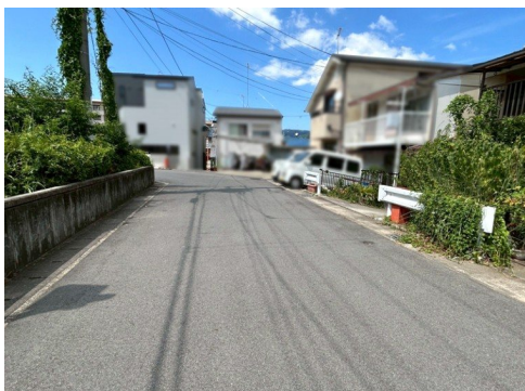
暗渠新設：旧農業用水路 宅地:81.98㎡/用悪水路:17㎡