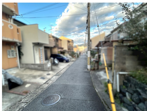
木・鉄筋コンクリート造