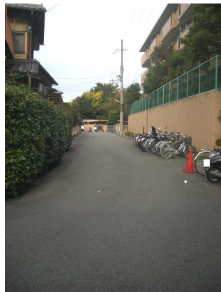
隣接地に外部の月極駐車場がございます