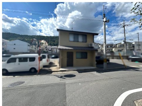
隔切り部分：約2.8m接道