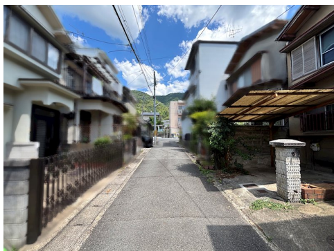
私道負担約10.17m 2 土地面積に含 司法書士指定有