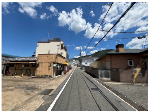
現況古家付（約25坪）未登記建物（現状有姿） 売主の契約不適合責任免責