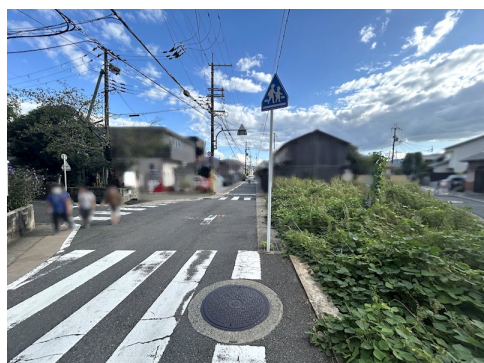
セットバック有 私道負担約16.72㎡土地面積に含む ガス・下水の引込なし