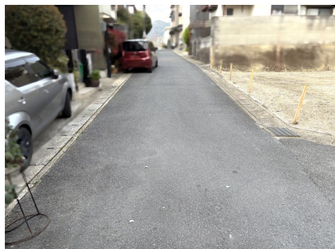
土地寸法はテープ測定の為、確定測量とは異なります