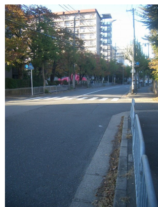
高温差湯式給湯 駐車場：8000～10000円/月(空き状況随時確認要)