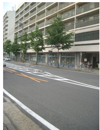
山科幼稚園355m・西念寺こども園250m