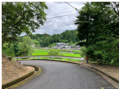
上水：前面引込有（口径75mm）/敷地内引込無