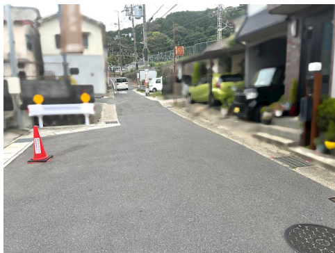
北側に2m以上の擁壁有 売主の契約不適合責任免責