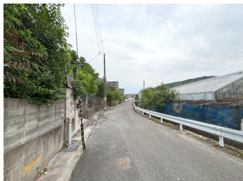
現状有姿 契約不適合責任免責 買替特約相談 明渡相談 宅盤面高低差有