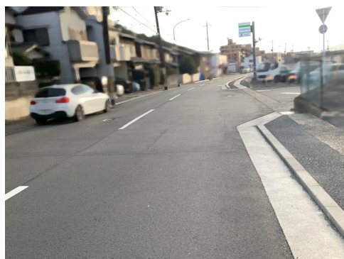
現況上物：木造2階建/3DK