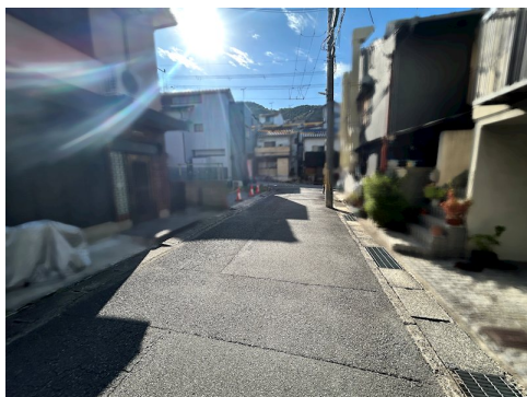
別途私道負担約13.5㎡有