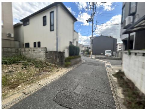
別途私道負担約12.43㎡有 セットバック約1.23㎡有 位置指定道路：昭和44年8月28日 第2309号