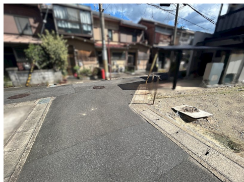
私道負担約34.39㎡土地面積に含む 北側セットバック約0.15㎡要

現況と異なる場合には現況を優先します。 該当物件が建築条件付き宅地だった場合、土地売買契約締結後3カ月以内に売主と住宅の建築請負契約を締結していただくことを条件として販売いたします。 この期間内に住宅を建築しないことが確定したとき、または住宅の建築請負契約が成立しなかった場合は、土地売買契約は無効となり、 受領した金額は全額無利息でお返しします。