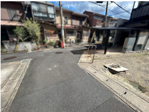
私道負担約34.39㎡土地面積に含む 北側セットバック約0.15㎡要