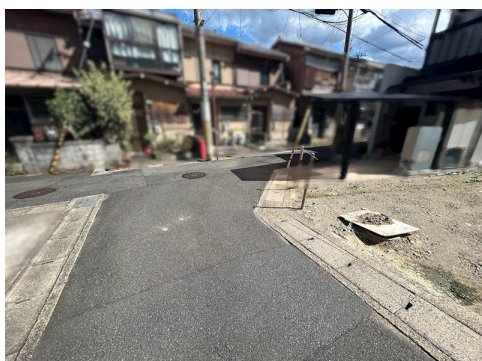
私道負担約34.39㎡土地面積に含む 北側セットバック約0.15㎡要