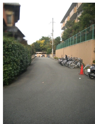
契約不適合責任免責 引渡：2025年8月以降