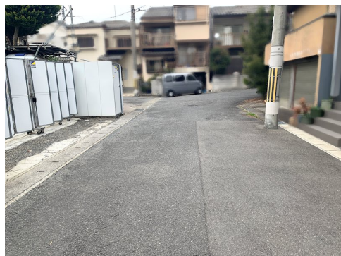
上水道：前面道路配管75mm/下水道：前面道路200mm、引込管：150mm/ガス管：前面道路50mm、引込管：20mm 境界確定は行っておりません 現況更地ですが敷地内に仮設トイレ、プレハブが設置されています