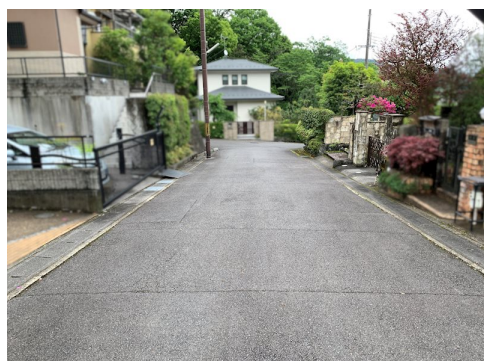
風致地区第3種地域（風致地区の為建ぺい率40%制限） 部分有）