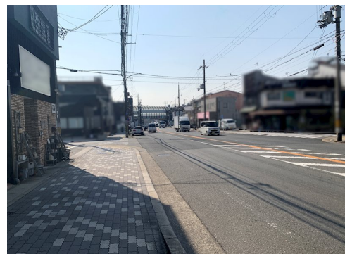
空間創出型高度地区 外環状線等沿道特別用途地区 売主の契約不適合責任免責