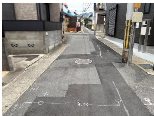
私道負担約15.6㎡土地面積に含