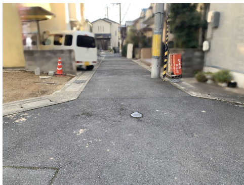
私道負担約15.6㎡土地面積に含