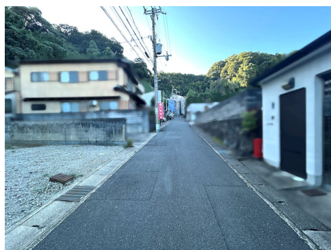
別途私道負担約16.93㎡有