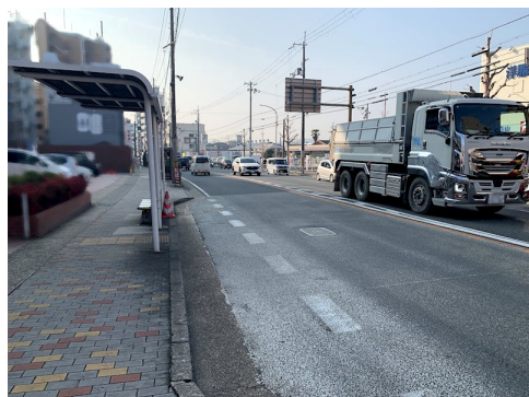
外環状線棟沿道特別用途地域