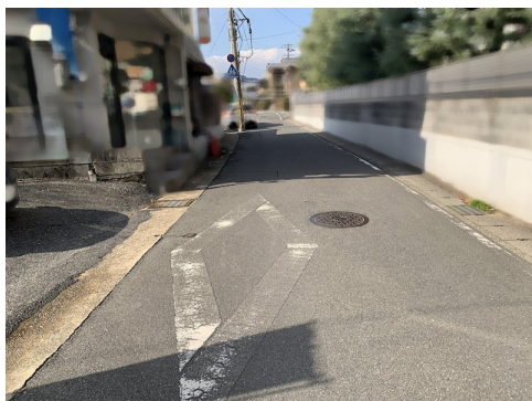
風致地区第5種地域