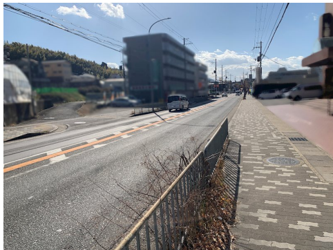
外環状線等沿道特別用途地区 上水・下水・ガス引込無し