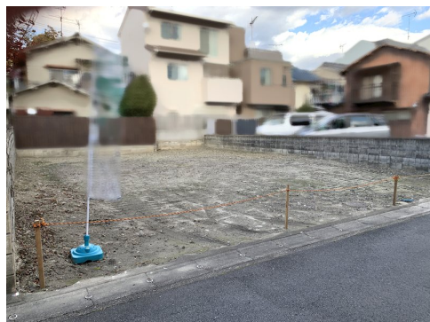
私道負担約21.28㎡土地面積に含