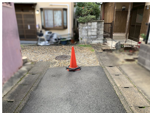
セットバック約3.52m 2 要