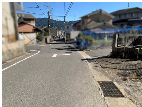
風致地区第三種地域