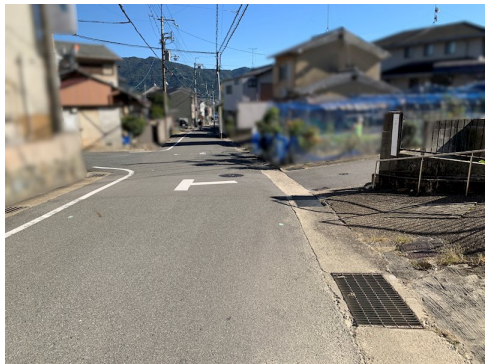
風致地区第三種地域