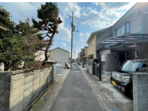
公簿面積:191.73㎡/建築確認対象面積:約184.92㎡ セットバック0.3m有 東側:非道路 ガスは個別プロパンorオール電化