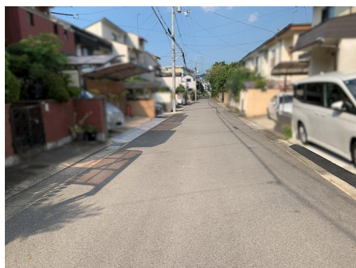
増築未登記部分約48㎡有 1棟4戸建の連棟住宅