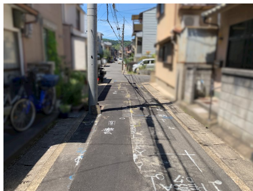
増築未登記部分有