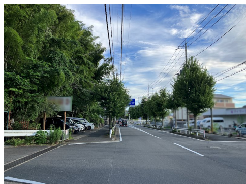
現況：山林 法地 宅地造成工事規制区域