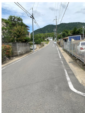
宅地造成工事規制区域