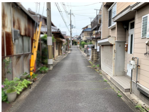
古家：木造3階建/4DK/駐車可(シャッター付ガレージ) 現状有姿渡し 契約不適合責任免責 司法書士指定有