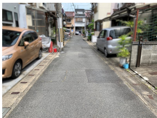
3戸1テラスハウス端家 1階増築後面積約30.37㎡