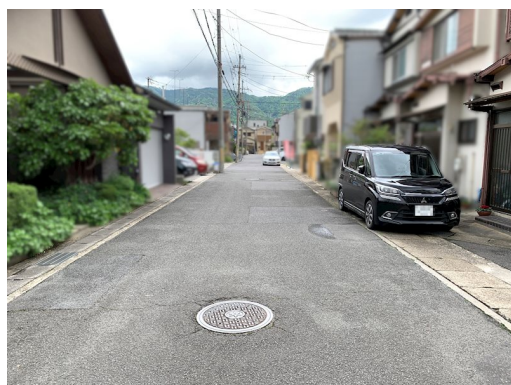
増築未登記部分有