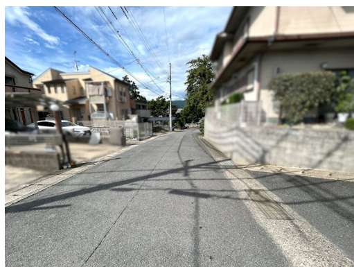
宅地完成工事規制区域