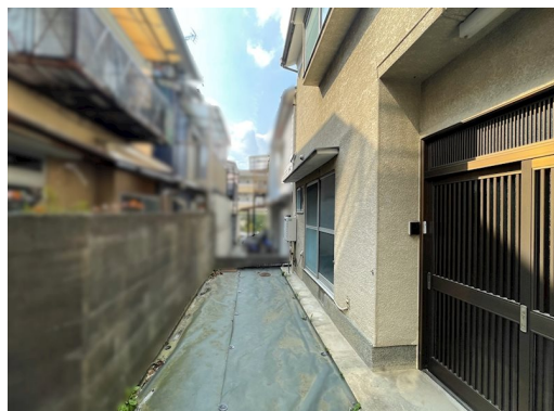
専用通路22.49㎡持分2分の1 再建築不可

現況と異なる場合には現況を優先します。 間取りの「S」はサービスルーム（納戸）です。 価格は物件の代金総額を表示しており、消費税が課税される場合は税込と表記の上、税込価格で表示しております。