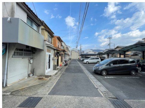
角地緩和 建ぺい率70% セットバック約1.65㎡要 私道負担約7.8㎡土地面積に含む