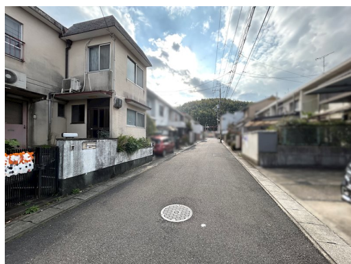
構造：鉄筋コンクリート・木造陸屋根・亜鉛メッキ銅板葺