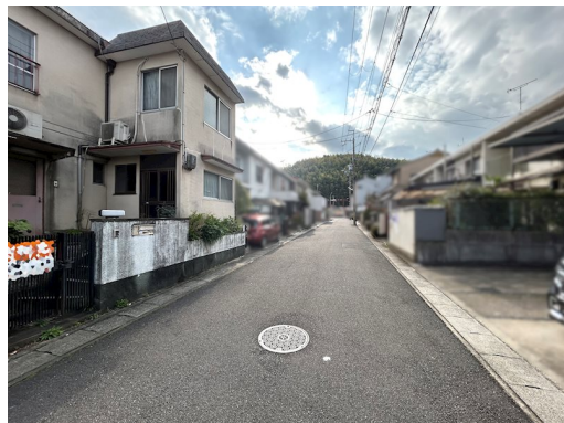
構造：鉄筋コンクリート・木造陸屋根・垂鉛メッキ銅板葺