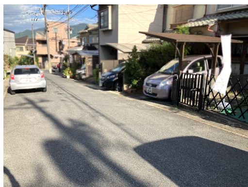
南西側（裏側）：幅員約1.7m 非道路（水路敷） 土砂災害警戒区域