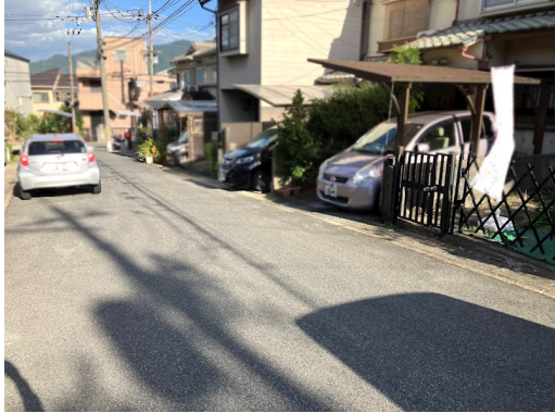
南西側（裏側）：幅員約1.7m 非道路（水路敷） 土砂災害警戒区域