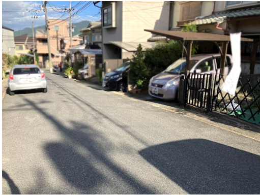
南西側（裏側）：幅員約1.7m 非道路（水路敷） 土砂災害警戒区域