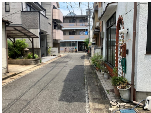
別途私道負担約14m 2 有

現況と異なる場合には現況を優先します。 該当物件が建築条件付き宅地だった場合、土地売買契約締結後3カ月以内に売主と住宅の建築請負契約を締結していただくことを条件として販売いたします。 この期間内に住宅を建築しないことが確定したとき、または住宅の建築請負契約が成立しなかった場合は、土地売買契約は無効となり、 受領した金額は全額無利息でお返しします。