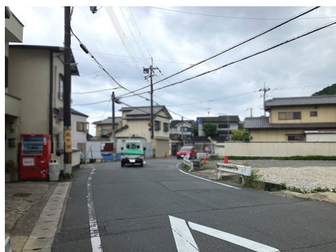
東側公道6mに接道は占有橋部分 占有橋撤去及び新設は買主負担 風致地区第3種地域 土砂災害警戒区域