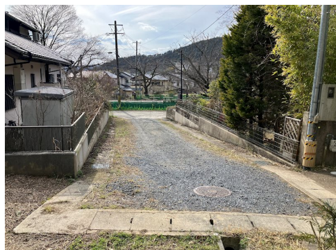
位置指定道路36番12（持分2分の1）所有権有 風致地区第3種地域