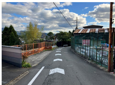
風致地区第3種地域 宅地造成工事規制区域 ライフラインの引込要 敷地に高低差あり