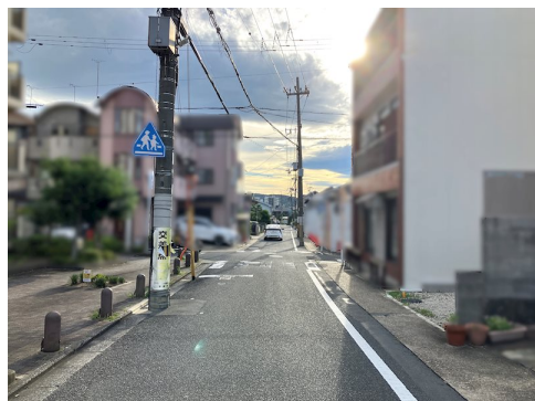
南側は道路ですが道路明示は行っていません