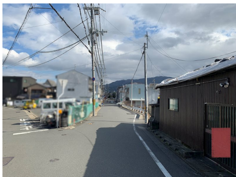
別途62.80㎡の官地あり 当該地番上に未登記建物あり(約39㎡) 専有使用料65,000/年