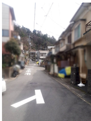
建ぺい率オーバー